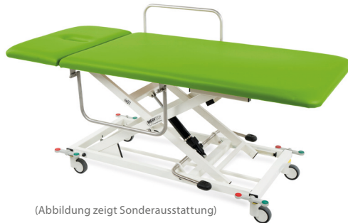
(Abbildung zeigt Sonderausstattung)